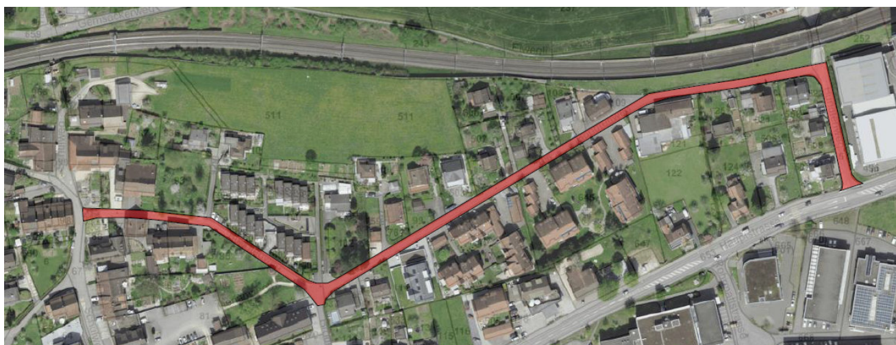
Projektperimeter, Gesamtlänge: ca. 600m, Gesamtfläche 3'200m 2

Im Jahr 2022 soll das Bauprojekt der Strasseninstandsetzung erarbeitet und die Kanal-TV Aufnahmen sowie Schadstoffuntersuchungen von Belag und Untergrund (PAK etc.) durchgeführt werden.